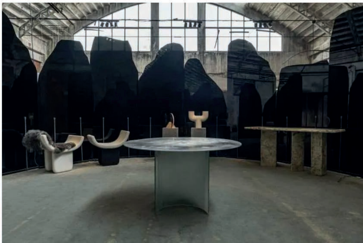
Temenos Installation. Studiopepe. Galerie Philia. Baranzate Ateliers.