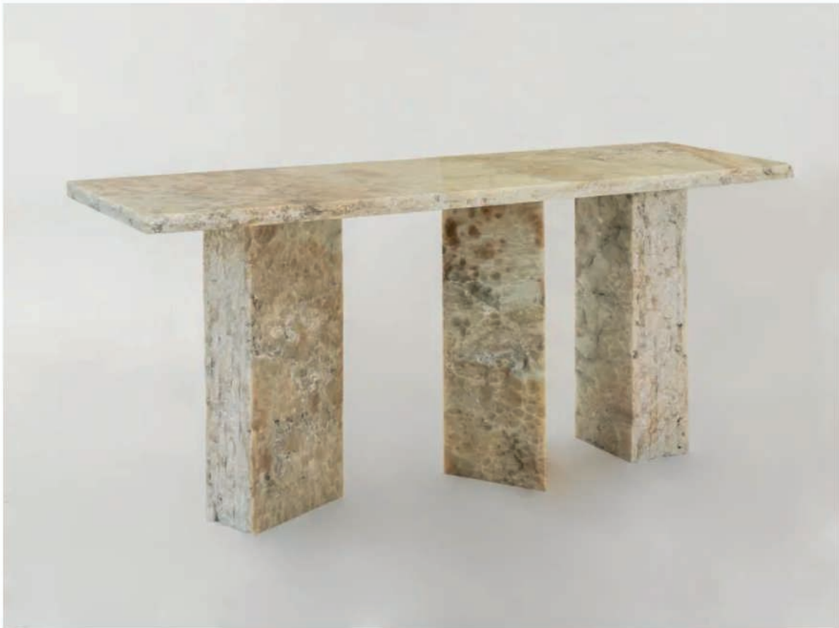
Shu, consola de ónix, Studiopepe.

El uso de materiales naturales, elaborados a mano por hábiles artesanos, es sorprendente y refinado. Una mesa baja de ónix se apoya en prismas de madera quemada (una antigua técnica japonesa utilizada para hacer la madera más resistente), mientras que otra tiene una estantería hecha con capas de espejo, color y cristal que crean un efecto de luna. Los portavelas y jarrones están hechos de mezclas de piedras con vidrio fundido y lava: "Nos gusta trabajar con combinaciones inusuales, yuxtaponiendo materiales ásperos y humildes con otros sofisticados y preciosos. Se eligen cuidadosamente para que puedan resistir el paso del tiempo. Al fin y al cabo, el dúo está desencantado con el énfasis que la comunicación actual pone en la sostenibilidad y cree que la única forma de avanzar es eliminar los productos mediocres o basados en conceptos desechables. " Un producto ecológico es una contradicción en los términos, el verdadero reto sería no producir y no consumir", dice provocativamente la diseñadora. "Si acaso, el tema es la pátina: las manchas del mármol de la cocina forman parte de su textura". El mármol vive, evoluciona y las marcas que lo 'arruinan' le añaden valor, mientras que un material pobre simplemente se deteriora".